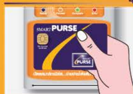
แตะบัตรค่าไว้จนได้ยินเสียงบีบๆ