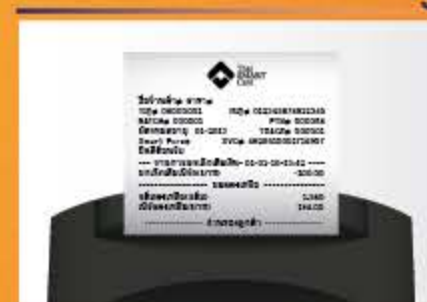
หน้าจอแสดง "ทำรายการเรียบร้อย" เครื่องจะทำการพิมพ์สลิป

ติดต่อสอบถามได้ที่ 02-631-2555, 083-490-1105-6 www.thaismartcard.co.th