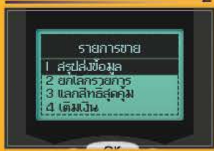
กดเลข 1 สรุปส่งข้อมูล และกดปุ่มสีเขียว