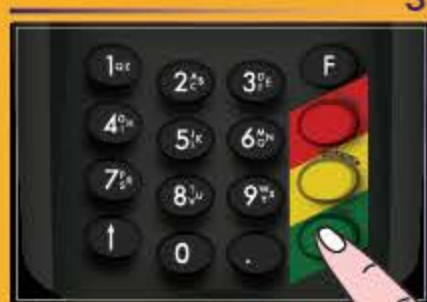
กดปุ่มเขียวเพื่อยืนยัน