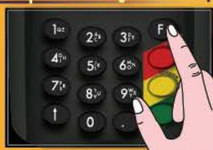
กดปุ่ม F ทำรายการ