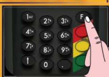
กดปุ่ม F ทำรายการ