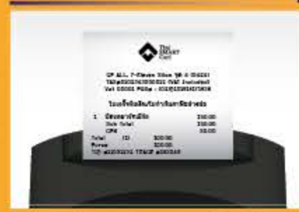
เครื่องจะทำการพิมพ์สลิปเมื่อสรุปส่งเรียบร้อย