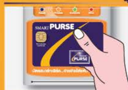
แตะบัตรค่าไว้จนได้ยินเสียงบีบๆ