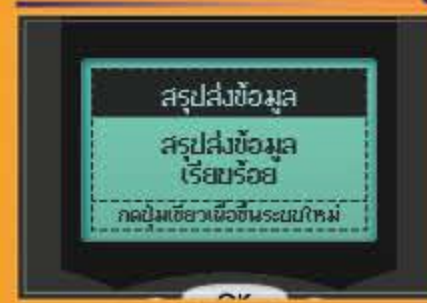
หน้าจอแสดง "สรุปส่งข้อมูลเรียบร้อยแล้ว" กดปุ่มเขียวเพื่อเริ่มระบบใหม่