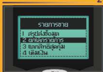
กดเลข 2 ยกเลิกรายการ และกดปุ่มสีเขียว