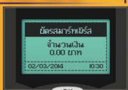
หน้าจอพร้อมขาย