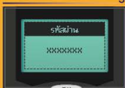
ใส่รหัสผ่าน และกดปุ่มสีเขียว