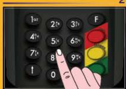
ใส่จำนวนเงินที่ต้องการ