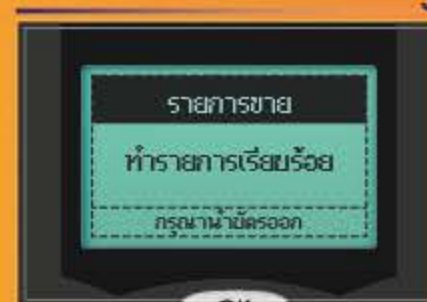
หน้าจอแสดง "ทำรายการเรียบร้อย"